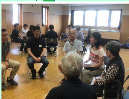
第4回ぴあチアーズの様子

会費：脳卒中者・その家族（1人）500円 （1家族）1,000円 その他（ボランティア等）無料